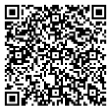
在宅ワーク 登録コード

オンライン交流会への参加申し込みには、事前に「在宅ワーク支援事業」へのWEB登録が必要となります。右記の「在宅ワーク登録」コードから、ご登録をお願いいたします。