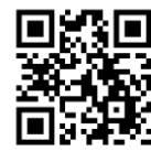
ホームページは こちらから

キャリア・ママは、子育て中の女性やシニアをはじめ、多様な働き方を求める方をサポートしています。設立以来在宅ワークの可能性を追求し、多くのワーカーと企業をつなげてきました。初心者でも取り組みやすいものから、スキルを活かせるものまで、幅広いお仕事で「自分らしく働きたい」人を応援しています。