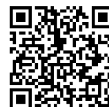
お申込みはコチラ

右記の2次元コードから、オンライン交流会へお申し込みをお願いいたします。尚、このページからは交流会開催情報のほか上記企業の「求人票」もご覧いただけます。